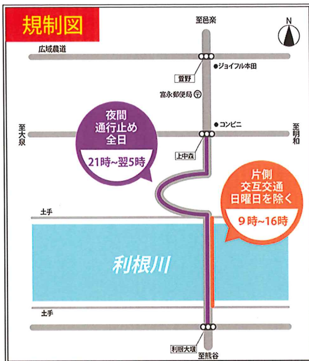
水資源機構利根導水総合事業所ホームページ (外部サイト)