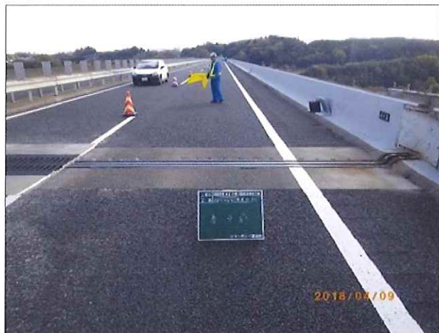
1. 損傷した伸縮装置

損傷した伸縮装置の撤去から新しい伸縮装置の設置まで、連続で工事を行う必要があるため、昼夜連続車線規制を行います。高速道路を安全・快適にご利用いただくための工事ですので、ご理解とご協力をお願いします。